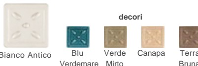
Bianco Antico Blu Verdemare Verde Mirto Canapa Terra Bruna